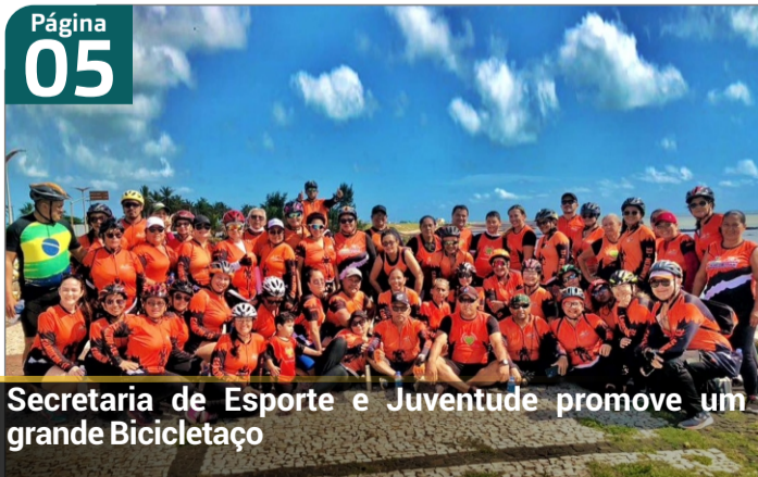
Secretaria de Esporte e Juventude promove um grande Bicicletaço