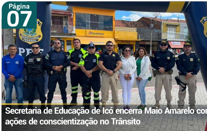
Secretaria de Educação de Icó encerra Maio Amarelo com ações de conscientização no Trânsito