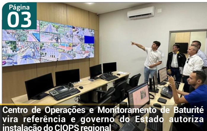
Centro de Operações e Monitoramento de Baturité vira referência e governo do Estado autoriza instalação do CIOPS regional