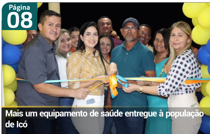
Mais um equipamento de saúde entregue à população de Icó