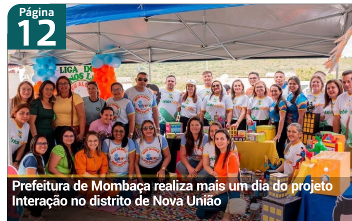
Prefeitura de Mombaça realiza mais um dia do projeto Interação no distrito de Nova União