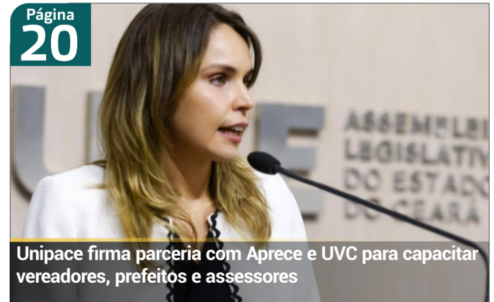
Unipace firma parceria com Aprece e UVC para capacitar vereadores, prefeitos e assessores