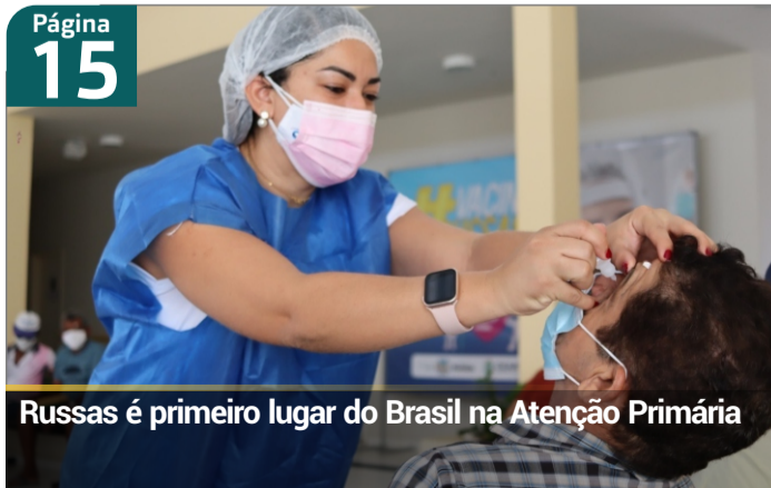
Russas é primeiro lugar do Brasil na Atenção Primária