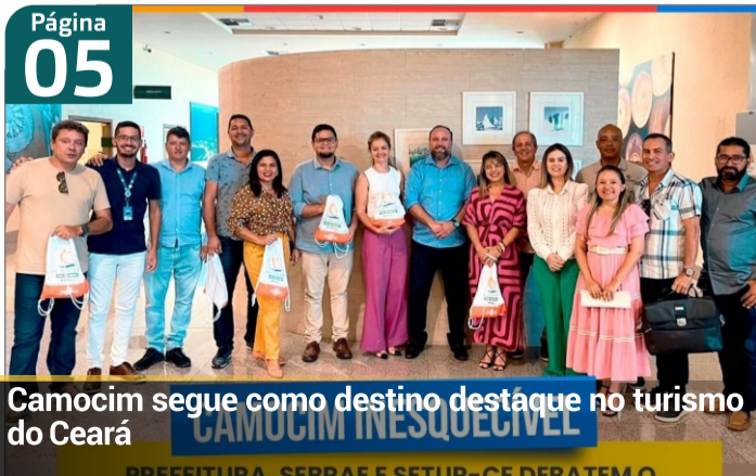
Camocim segue como destino destaque no turismo do Ceará