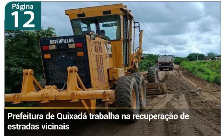
Prefeitura de Quixadá trabalha na recuperação de estradas vicinais